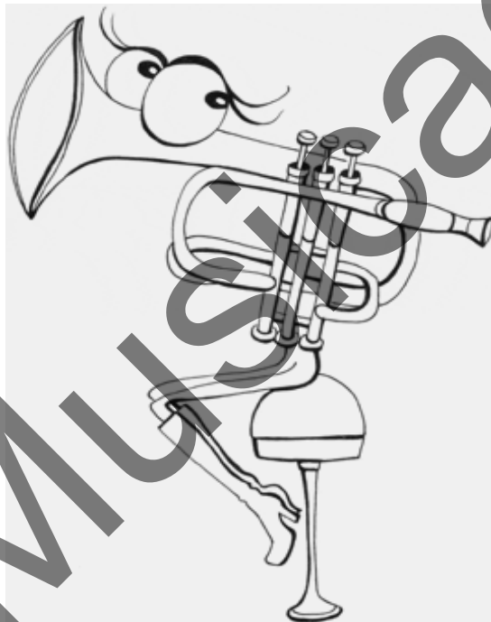
Grafica a cura di Mariapia Giardullo